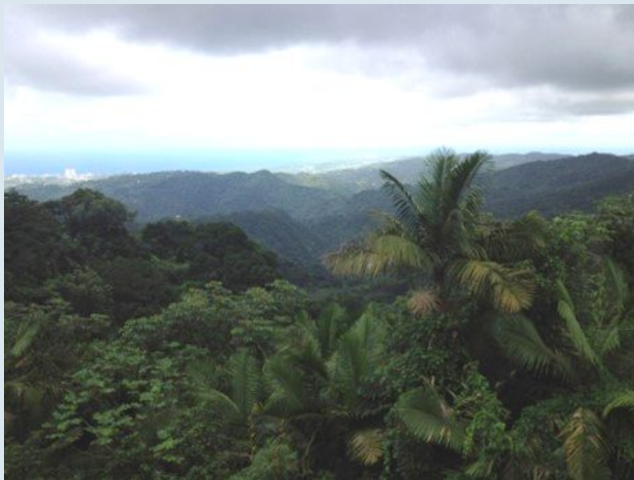
Rainforest View

Durante los últimos tres años y con el apoyo de la Iniciativa Andes-Amazonía de la Fundación Gordon & Betty Moore (la Fundación), ISLP ha movilizado apoyo legal pro bono a las organizaciones de la sociedad civil beneficiarias de la Fundación Moore en Brasil, Colombia y Perú que trabajan para promover los mejores estándares sociales y ambientales para proyectos de desarrollo de infraestructura que podrían resultar en la deforestación de áreas estratégicas del bioma amazónico.